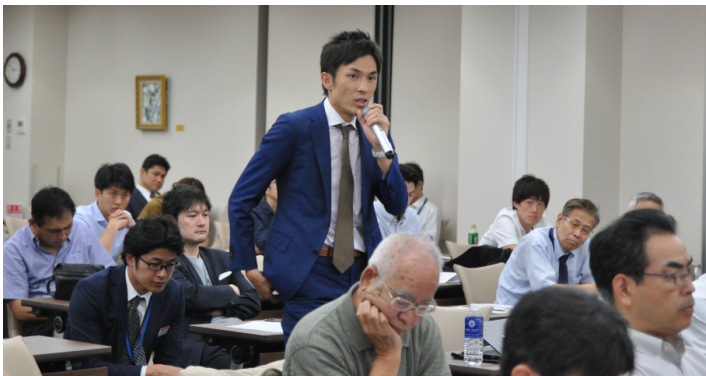
(研修会での質疑応答)

関西医科大学整形外科春期セミナー 関西医科大学整形外科秋期研修会 北河内整形外科セミナー 枚方セメントTHAセミナー 関西医科大学脊椎グループ研究会（KSG）年2回 術中脳脊髄モニタリングセミナー MISt手術手技セミナー 京阪手の外科セミナー 年2回