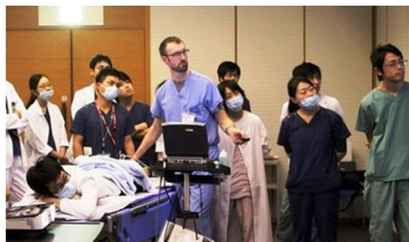
米国救急専門医によるER指導(平成27年度)