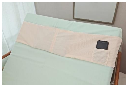
実際に装着した「アイスパッドベルト」

1つ目は、発熱時などに入院患者が使用する冷却材を簡単に、かつ適切な位置に固定できる「アイスパッドベルト」を、ワンポイント社の協力を得て実現。ベッドを起こした際にずれ落ちたり床に落下しがちだった冷却材を保持し続けることができ、スマートフォンを入れておけるポケットもついていて、入院生活中のちょっとした不便を解消できる製品です。