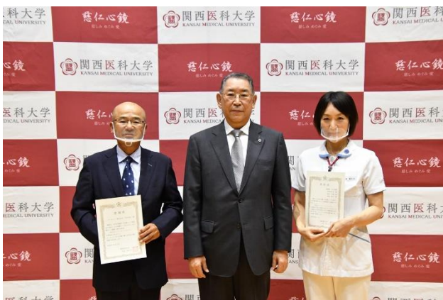
「アイスパッドベルト」開発会社と発案者、中央は友田学長