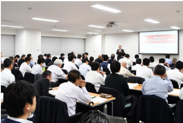
会場を埋め尽くした製販企業・メーカー担当者