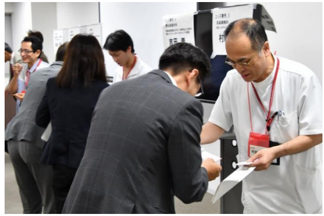
当日その場でニーズを発表した医療従事者と名刺交換可能