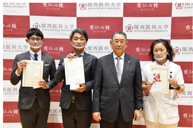
「術後術後衣」開発会社と発案者、中央右は友田学長