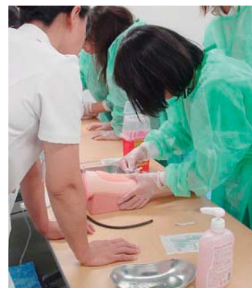
シミュレーターを使った実技

これは枚方市内に居住する潜在看護師に対し職場復帰を支援するもので、附属枚方病院看護部教育委員会の協力を得て、点滴・静脈注射、吸引、輸液・輸注ポンプの使用方法など、シミュレーターを用いて、実技を中心とした内容で実施されました。長期にわたり臨床現場から離れていた9名の参加者は、熱心に、真剣に取り組んでいました。指導に当たった看護師さんは、「少しでも復職の一助になればと願っています」とコメント。