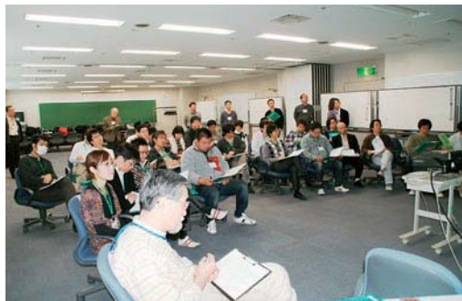
ワークショップ形式での全体討議