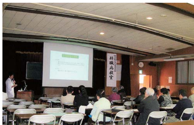
講師のわかりやすい説明に熱心に聞き入る受講者

開催しています。一人でも多くの方が参加し、肝疾患に対して少しでも理解を深めて頂きたいと思っています。今後の予定としては、1月29日(土)に医師向けセミナーを、2月5日(土)には下記の第10回肝臓病教室を開催します。