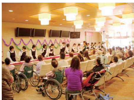
ハンドベルでクリスマス気分存分に