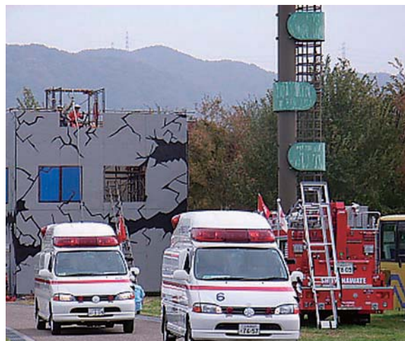
大規模地震発生、亀裂の入った建物

確かに緊張もしましたが、日本のように堅苦しい時間配分や司会進行などがなく、参加者がゆったり、楽しみながら発表を聞いてくれているという印象でした。今後もぜひ国際学会に参加していきたいと思わずし、他の看護師の方々にも国際学会での発表を経験し、おもしろさを感じてもらいたいと思います。