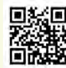
オール女性医師キャリアセンター 特設サイト

また、センター開設を記念し、センターの活動や本学の福利厚生などを紹介するキックオフ講演会(仮称)の開催も検討していきます。