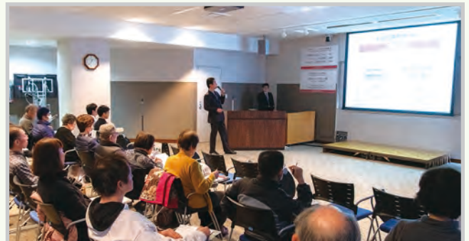
講演を行う福井病院准教授(中央)

後他の疾患についても講演を行ってほしい」等の感想が寄せられ、市民からの難病に関する関心の高まりが感じられました。