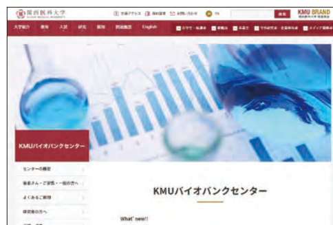
KMUバイオバンクセンター特設ページイメージ(現在構築中)

が、それがなぜなのか、細胞や遺伝子レベルで解析することが容易になります。今回のバイオバンクセンター設立から新たな治療法や新薬開発へつなげ、関西医大発の画期的な成果を挙げるのが期待されています。