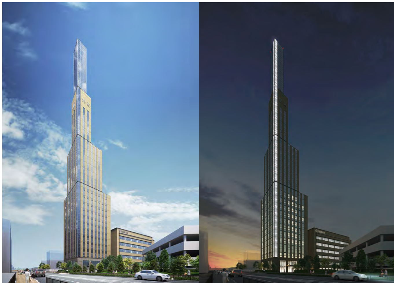
昼と夜のタワー棟完成予想図（2021年9月竣工予定）